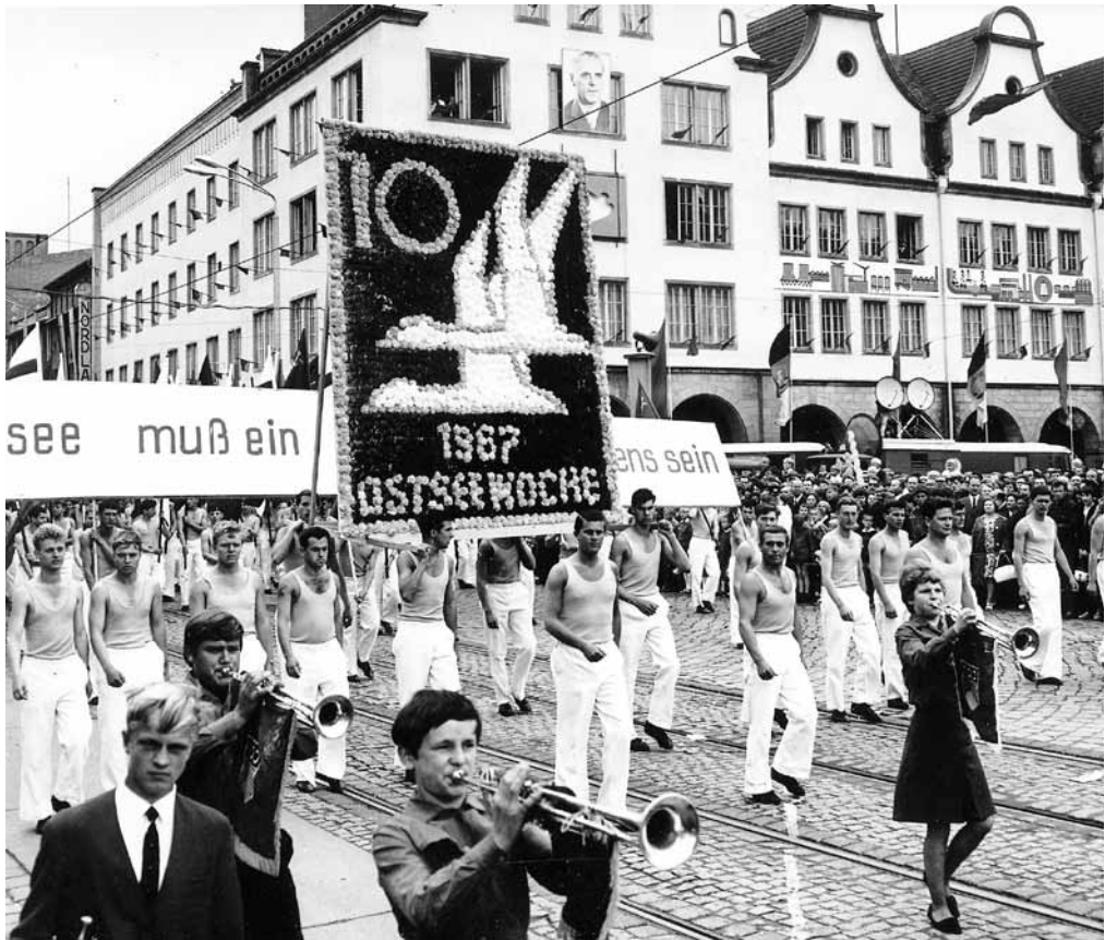
Opptog under Østersjøuken i Rostock 1967.

de tjenestereisene han foretok til Norge. 96 Nå og da overvåkte Stasi enkelte norske virksomheter slik som firmaet Norkommerz i Oslo og deres kontor i det internasjonale handelssentret i Øst-Berlin. 97 Det samme hendte med Norsk Hydro som likeledes holdt til i handelssentret. Ansvarlig for disse virksomhetene var informanten «Kunze». 98 Overvåkingen av norske virksomheter handlet ikke bare om å analysere mulige norske spionasjeaktiviteter i DDR, men også om å registrere problemer og feil forårsaket fra DDRs side og å søke å rette opp dette. Det gjaldt spesielt vansker i forbindelse med leveranser til Norge. 99