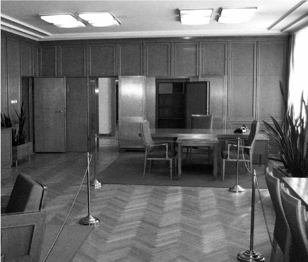
Stasis absolutte sentrum. Fra dette kontoret styrte sjefen Erich Mielke hele den gigantiske virksomheten fra 1957 til 1989.

greatest triumphs.» 32 Omvendt er vurderingen slik hos tidligere HVA-ansatte: « CIAs kupp [...] av HVA-materiale som kan brukes til å rekonstruere informasjonen om våre kilder, hører med blant våre største nederlag.» 33 Operasjonens betydning understrekes av at president George Bush d.e. umiddelbart ble orientert da CIA fikk tak i Rosenholz-kartoteket. 34