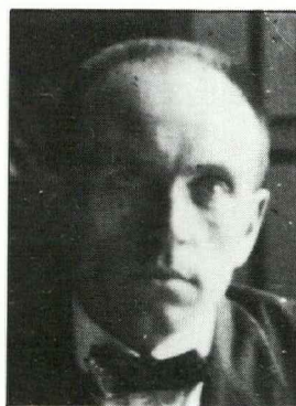
Willy Brandt mellom motpolene i Norge: Erling Falk og Martin Tranmæl.

I begynnelsen av juni 1933, etter et opphold på Vestlandet, var Brandts inntrykk fortsatt i overveiende grad positive, iallfall med tanke på økonomisk støtte til SAP. Men på den annen side hadde han også fått inntrykk av at DNA ikke var overbevist når det gjaldt SAPs muligheter til å bli den samlende kraft i tysk arbeiderbevegelse. 15 Når det gjaldt ham personlig, var en «meget vennlig når det gjelder personlig hjelp», men han hadde inntrykk av at nordmennene «bare meget langsomt blir