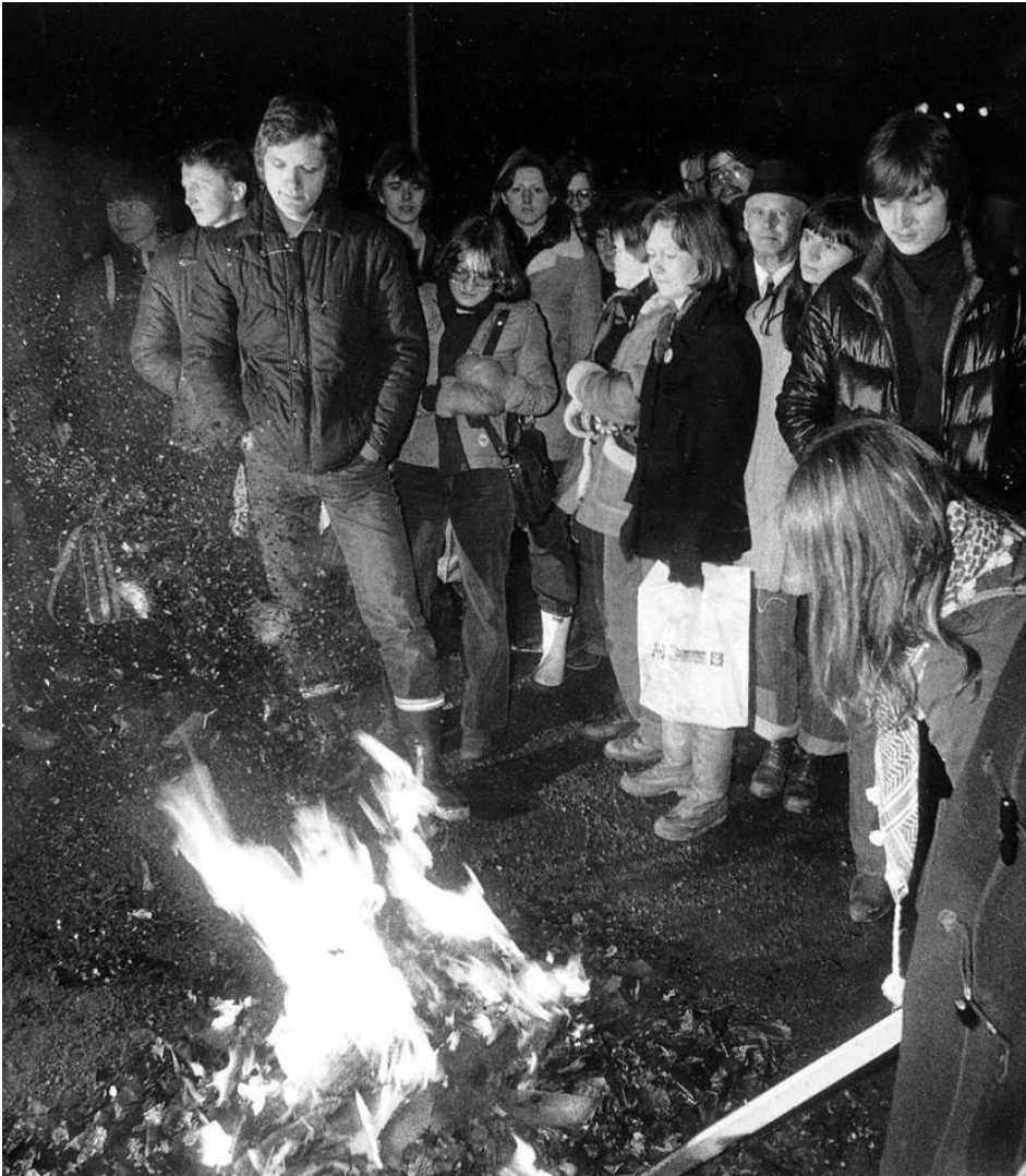
I kampen mot sexindustrien var brenning av pornografiske blader en av aksjonsformene.

Fram mot Kvinnefrontens 4. landsmøte i november 1977 fortsatte arbeidet med å skape et bedre massegrunnlag for fronten. Landsmøtet vedtok i den forbin-