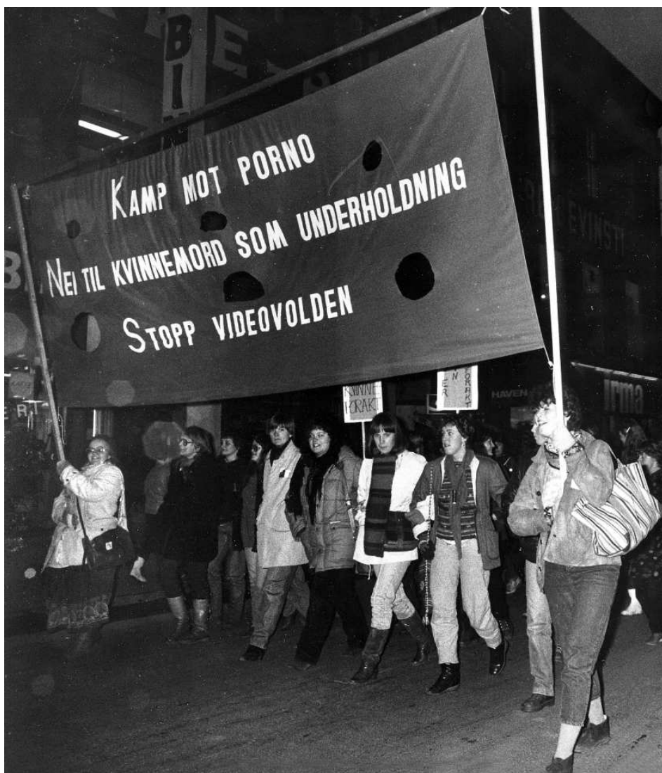
Kampen mot kvinneundertrykking og pornografi fortsatte på 1980-tallet.

Kvinnefronten både form og innhold. Debatten om AKP(ml), imperialismen og den ideologiske undertrykkningen av kvinner var omfattende fram mot frontens landsmøte i 1980. Landsmøtet vedtok en ny plattform for Kvinnefronten. Begrepet monopolkapitalen forsvant ut