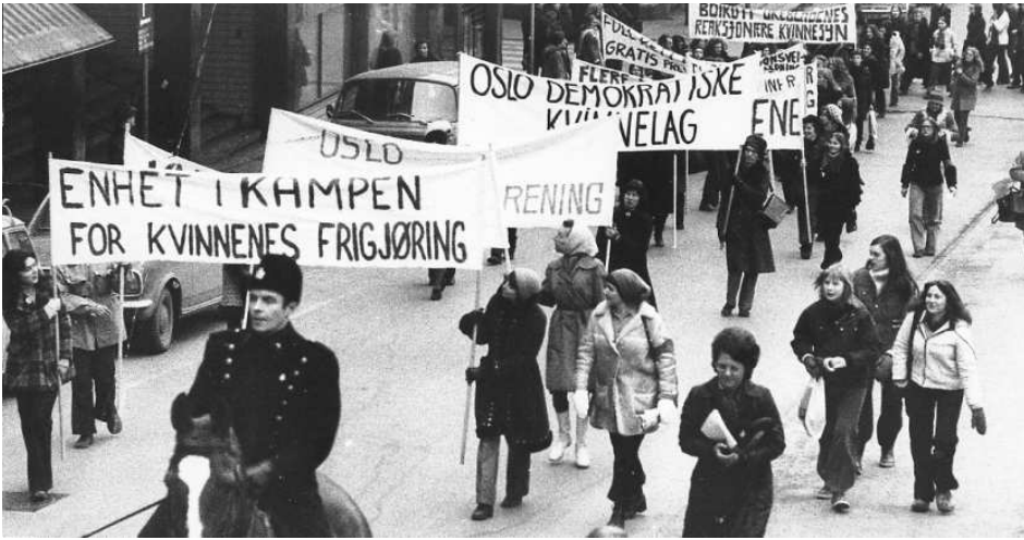
Den internasjonale kvinnedagen 1973. Hovedparolen var ment å samle brede grupper i kampen for kvinners frigjøring og rettigheter.

Kvinnefronten å ikke slutte seg til Rød Arbeiderfronts tog, siden ikke alle gruppene i fronten var enig i dette. Medlemsbladet påpekte: «KF er en interesseorganisasjon for alle kvinner, ikke bare for en liten gruppe bevisstgjorte og mer eller mindre politisk skolerte studenter og skoleelever. [...] KF har medlemmer fra Senterpartiet, Venstre, DnA, SF og SUF(ml), pluss en god del uavhengige, men vi akter ikke å la oss kuppe av noen av disse grupperingene. Vi driver ikke partipolitikk, men kvinnekamp!» 11