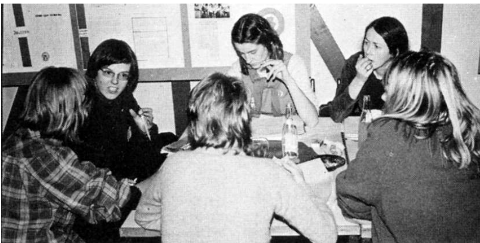
Gruppediskusjon på Kvinnefrontens landsmøte i 1976.

Fikseringen på klassekamp og den uttalte revolusjonære målsettingen for Kvinnefrontens virksomhet skjøv nå de rent feministiske standpunktene i bakgrunnen. Venstredreiningen gikk så langt at frontens politikk og paroler i tiden som fulgte fikk et islett av sektarisme.