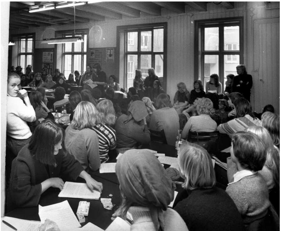
Fra konferansen «Brød og Roser» som ble arrangert av utbrytere fra Kvinnefronten.

rangerte en kvinnekonferanse i Oslo under navnet 'Brød og Roser'. Konferansen samlet 470 kvinner, de fleste fra Oslo og Akershus. Formålet var å etablere en ny anti-autoritær, radikal og partiuavhengig kvinneorganisasjon. På konferansen angrep utbryterne Kvinnefronten for å ha en sentralistisk organisasjonsform samt for frontens ensidige fokusering på økonomiske krav. 38 I tillegg til gruppeutmeldingene av Kvinnefronten kom en rekke individuelle utmeldinger, men ikke alle som ønsket å melde seg ut stod oppført i medlemsregistret eller hadde gyldig medlemskap i fronten. Begrunnelsene for utmeldingene var konsentrert rundt tre ho-