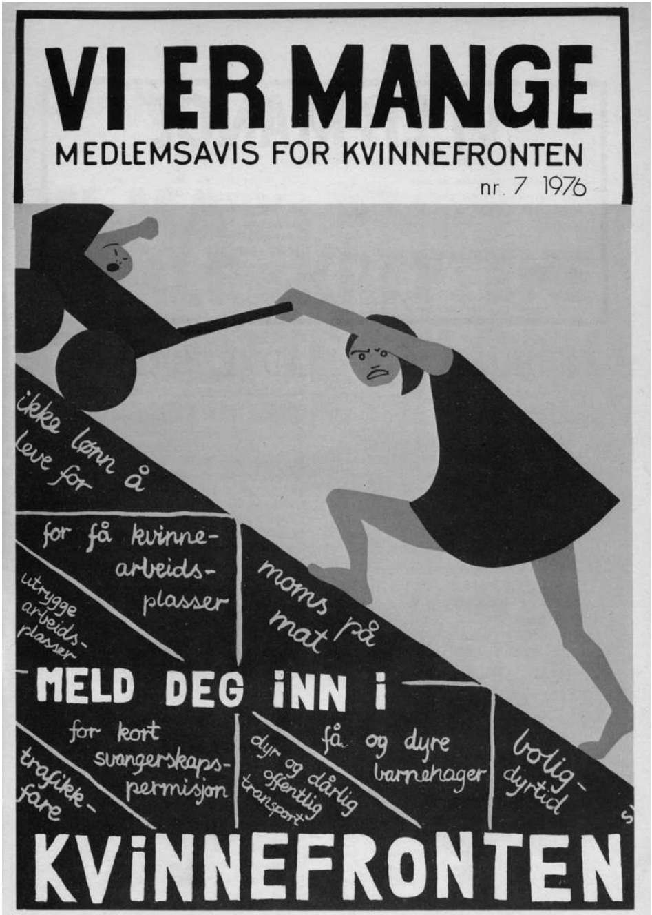
For å verve nye medlemmer ble det lansert ulike kampanjer. Denne plakaten skapte imidlertid reaksjoner fra flere som mente den ga et noe aggressivt inntrykk av kvinnen. (Forside i Kvinnefront 1976.)