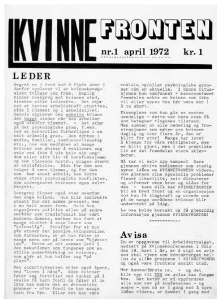
Faksimile av Kvinnefronten som ble distribuert etter Kvinnekonferansen i mars 1972.

Den 19. mars 1972 vedtok en kvinnekonferanse som samlet 150 deltakere i Oslo å etablere en bred kvinneorganisasjon under hovedparolen: «Kamp mot all kvinneundertrykking – For frigjøring av kvinnen.» Konferansen satte ned et arbeidsutvalg som skulle forberede et konstituerende landsmøte. Landsmøtet skulle så velge organisasjonens politiske plattform og ledelse. 6 I utgangspunktet eksisterte det tre hovedretninger innenfor datidens radikale kvinnebevegelse: nyfeminister, ml'ere og radikale sosialister. De ideologiske og politiske motsetningene mellom retningene var relativt store. Nyfeministene fokuserte på kampen mellom kjønnene og oppfattet patriarkatet som hovedfienden. Patriarkatet ble definert som en samfunnsordning