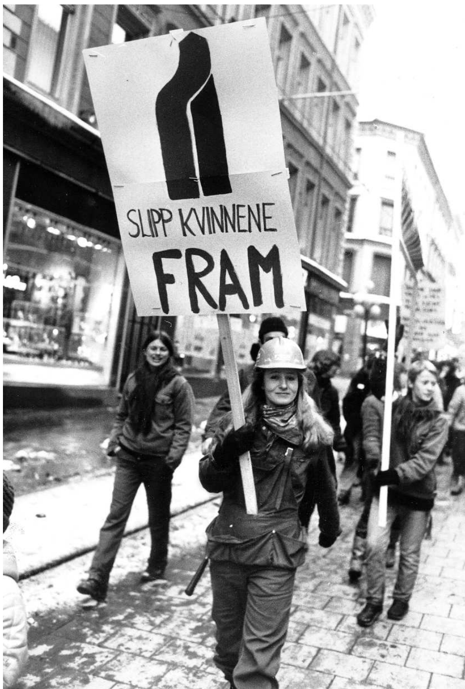
Innslag i demonstrasjonstoget på Kvinnedagen, 8. mars 1981.