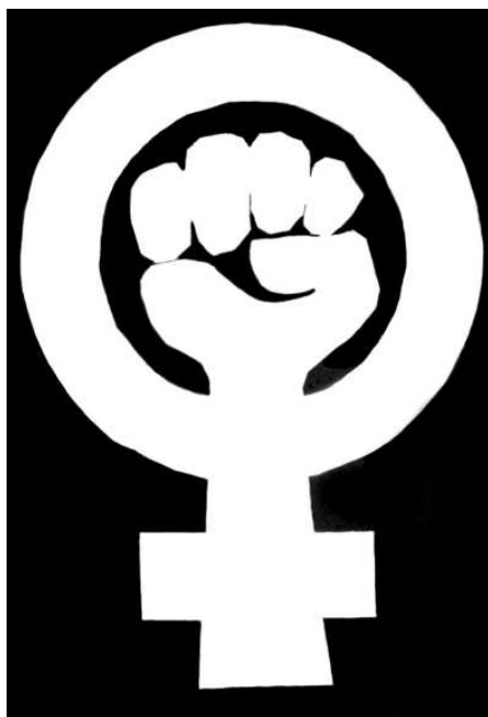
Kvinnefrontens kampsymbol ble innført i 1973.

Det gikk også et skille mellom ml'erne og de radikale sosialistene i spørsmålet om Kvinnefrontens massegrunnlag. Ml'erne gikk inn for at Kvinnefronten skulle ha en bred politisk plattform uten markerte sosialistiske standpunkter. Siden det politiske bevissthetsnivået varierte blant kvinnene, ønsket de ikke å hemme rekrutteringen ved å avgrense seg mot kvinner som ikke var erklærte anti-kapitalister, sosialister eller kommunister. Mange radikale sosialister ønsket derimot en snevrere og klart avgrenset sosialistisk plattform for Kvinnefronten. De begrunnet særlig dette med at det var nødvendig med et noenlunde enhetlig politisk grunnlag for organisasjonens arbeid. 10 I Kvinnefronten var det ml'ernes masselinje som vant fram. I forbindelse med 1. mai-demonstrasjonen i 1972 vedtok