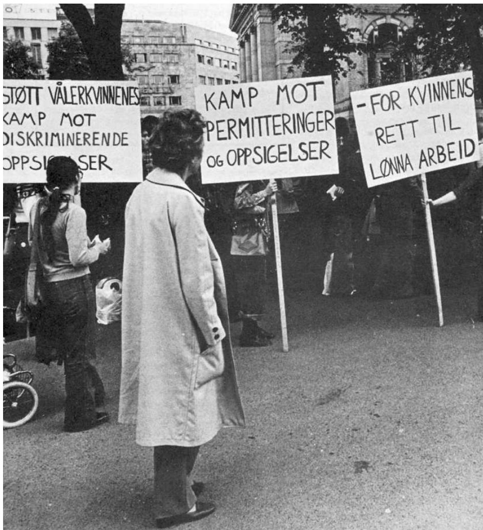
Kvinnefronten demonstrerte da 13 kvinner ble oppsagt ved Våler Skurlag i Solør.

Våren og sommeren 1975 ble omlaggingen av Kvinnefrontens politiske linje intensivert. På AKP(ml)s kvinnekongresser i mars 1975 ble det bestemt at fronten skulle delta i 1. maidemonstra-