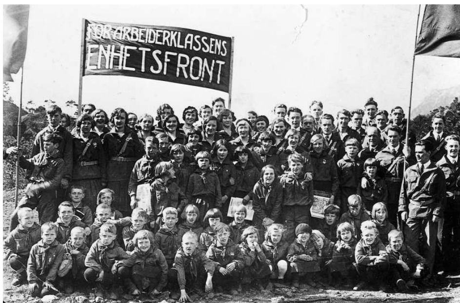
Unge pionerer i Stavanger demonstrerer for «arbeiderklassens enhetsfront» 1. mai 1933.

partiene om å søke direkte forhandlinger med ledelsene for de sosialdemokratiske partiene for å få reist en enhetsfront. Dette var et forvarsel om – noen vil hevde innledningen til – en omvurdering av sosialdemokratiet som lå til grunn for folkefrontpolitikken som ble satt ut i livet året etter og bekreftet av Kominterns 7. kongress i 1935.